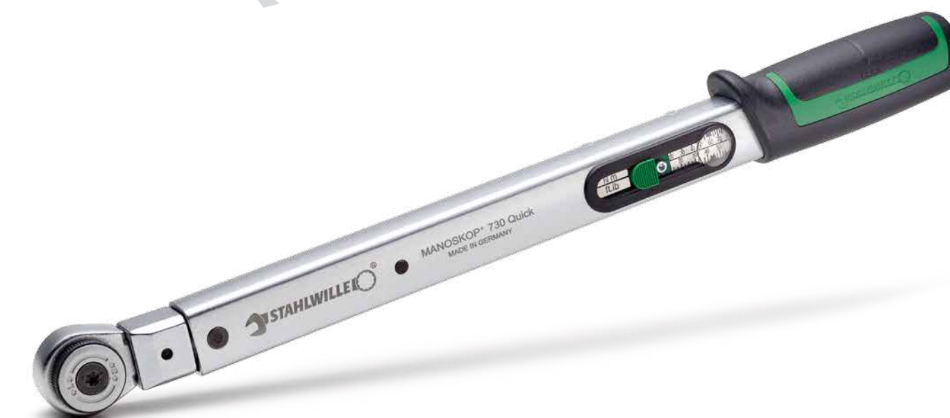
Chiave dinamometrica 730 Quick Service MANOSKOP® con attacco per utensili ad innesto